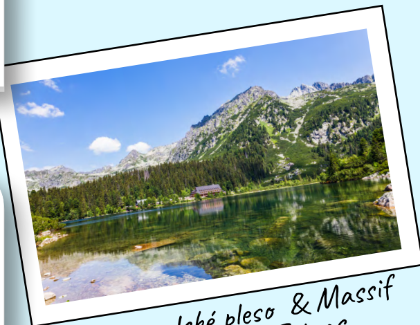
Lac Popradské pleso & Massif des Hautes Tatras