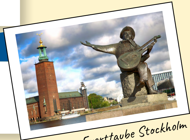
Statue Everttaube Stockholm

La cuisine SCANDINAVE remonte à l'époque VIKING à base de POISSONS, baies et de légumes RACINES.