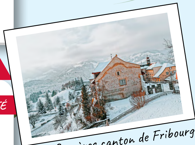
Gruyères canton de Fribourg

Le Rüblitorte a été mis au point en SUISSE Allemande. La recette a été reprise en ANGLETERRE avec le Carrot Cake.